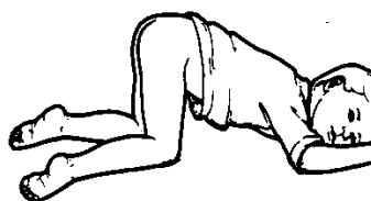
Figura 2: Niño acostado boca abajo. Las rodillas y la cadera están dobladas hacia el pecho.