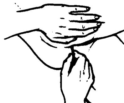
Figura 4: Meta la punta de la sonda al recto.