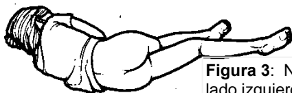
Figura 3: Niño recostado sobre el lado izquierdo. Pierna izquierda estirada y pierna derecha doblada en la cadera y rodilla.